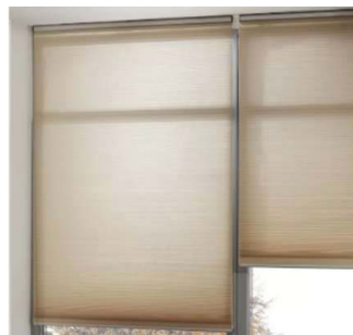
Montage vor das Fenster