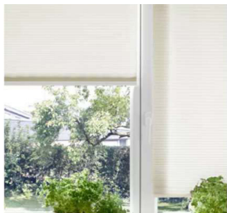
Montage auf den Fensterrahmen