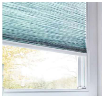
Montage in der Glasleiste