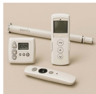
Elektrisch mit Funkoder Tastschalter